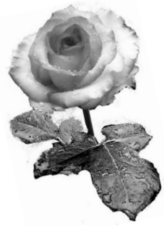
Дети, внуки, зятя, невестка.

Рубиновые сорок И внуки за столом, А сердцу также дорог Родной и милый дом. А чувства, как и прежде, Волнуют и томят, И светится надеждой Не потускневший взгляд. Да не уйдет, да будет Любовь и впредь жива, Когда прекрасны люди, Она во всем права.