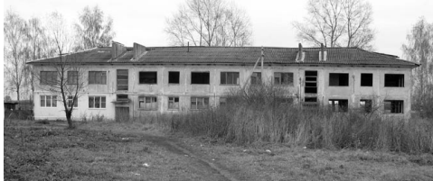
Дом, в котором есть жилые квартиры

Однако акулловцы со своей жизнью как-то смирились, но есть проблемы, которые их беспокоят. Первая – вода. В деревне есть водоразборные колонки, но в них часто не бывает воды, и тогда все население деревни идет к двум колодцам, расположенным одинаково далеко от ее центра, и находящимся в плачевном состоянии. В основном идут к одному, где всегда есть вода и она чистая, но располагается он в глубоком овраге, и благополучно подойти к нему можно только летом, в сухую погоду. Колодец не огорожен, к нему нет схода, хоть каких-то перил. Огорчает жителей деревни малое количество фонарей на ее улицах, плохая дорога к Акулову.